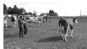
VOYAGE EN CORSE