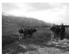
VOYAGE EN IRLANDE